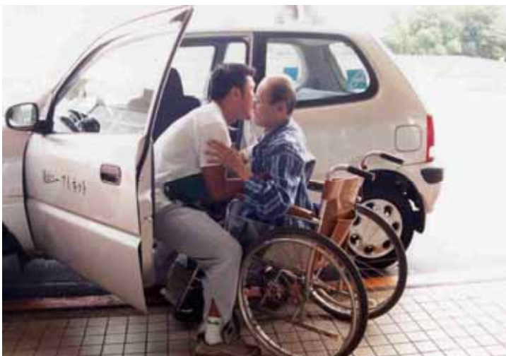
(訪問介護員による乗降介助)