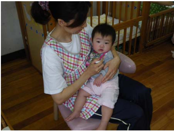
乳児の健康管理を行う看護師