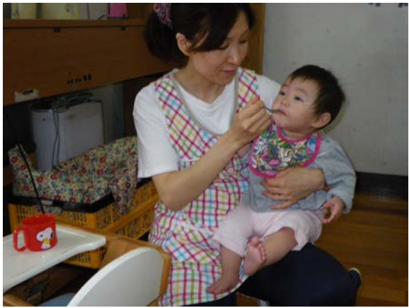
乳児の体調管理（水分補給）を行う看護師