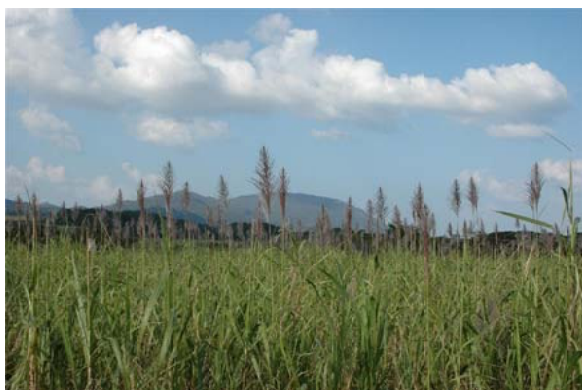
徳之島の基幹産物であるサトウキビ畑