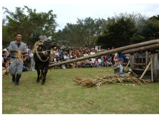
昔ながらの黒砂糖作りを再現して体験する祭り