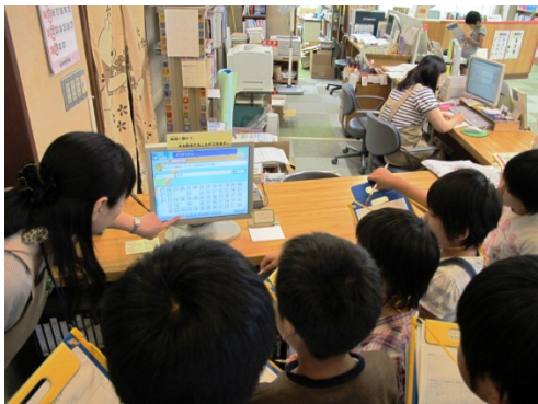
図書館（学友館）を見学に来た小学生