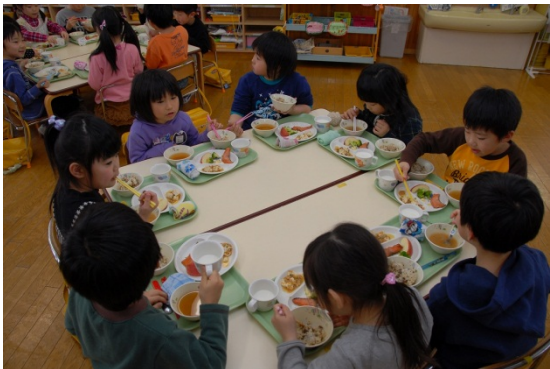
認定こども園で地元食材を使用した給食を食べる園児