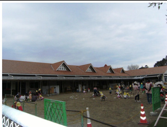
10 年以内に民営化を予定している 中央保育所