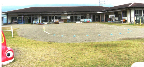
平成 25 年に民営化を予定している 野田原保育所