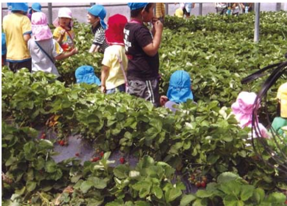
地元幼稚園児たちのイチゴ収穫体験

適用される規制の特例措置： ・ 特定農業者による特定酒類の製造事業 ・ 特産酒類の製造事業