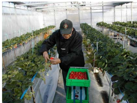
イチゴ（紅ほっぺ）の収穫風景