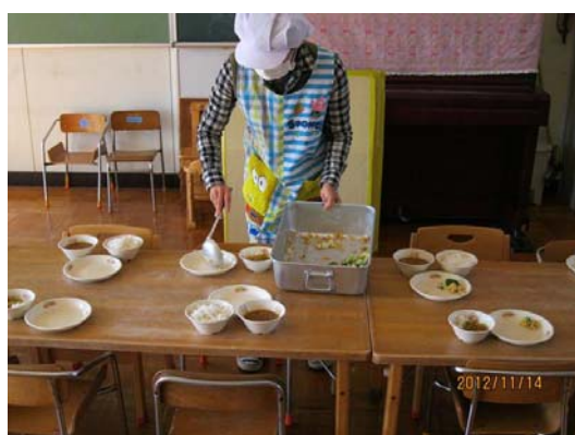
障害の特性に応じた食事の提供の様子

適用される規制の特例措置： 児童発達支援センターにおける給食の外部搬入方式の容認事業