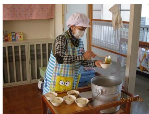
児童の個々の特性に応じた配膳の様子