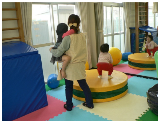
児童発達センターどれみ療育の様子