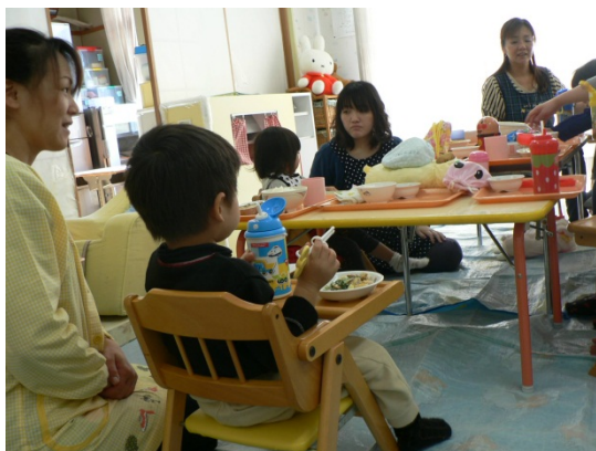
児童発達センターどれみ給食時の様子