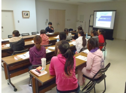
日本や寿都町の歴史や文化などを学んでいる風景