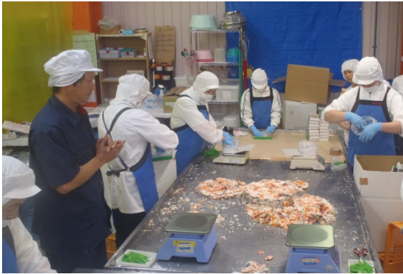
本町の名産「紅鮭の飯寿司（いずし）」の箱詰め作業の風景