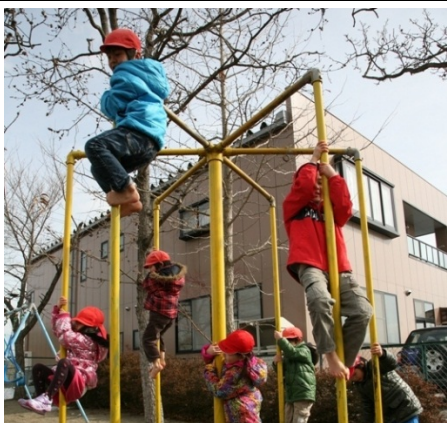
日常保育（外遊び）の様子