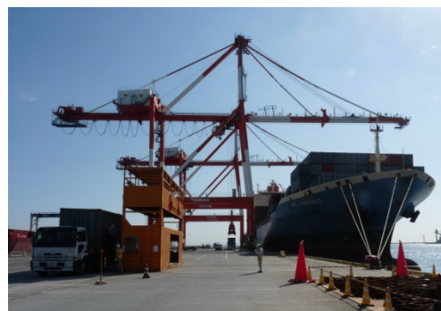
四日市港荷役風景