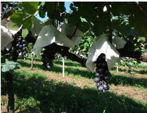
たわわに実った八街産ワインの 原材料となるぶどう