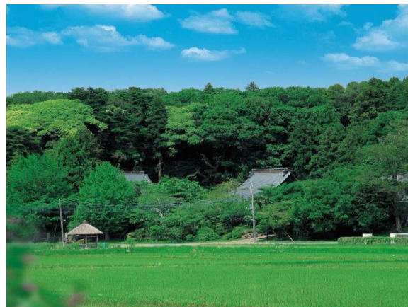
八街市の里山の風景