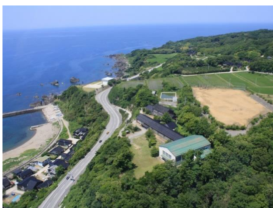
体験を行う学校蔵（旧西三川小学校）