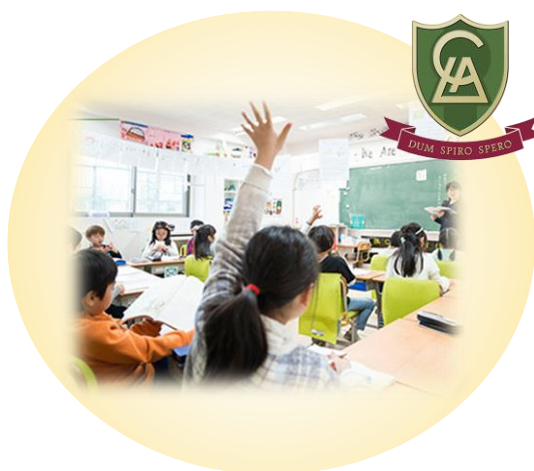
英語教育・ICT教育の推進