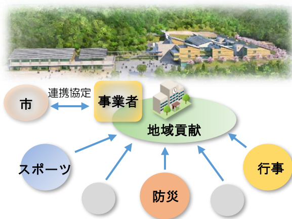
連携協定による校舎等解放の地域貢献