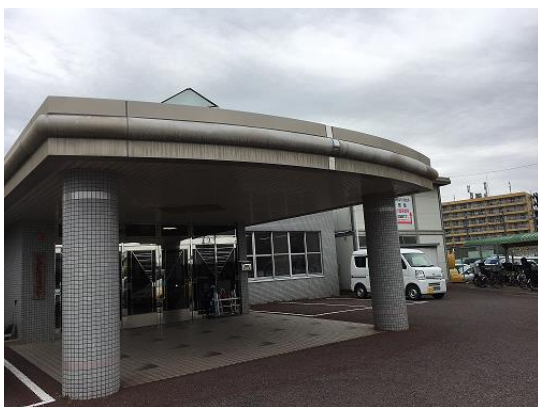
交野市立機能支援センター (児童発達支援センターへの移行施設)