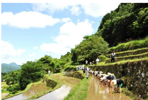
両合棚田の田植え風景