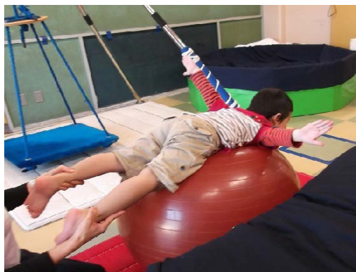
個別訓練の様子（作業療法）