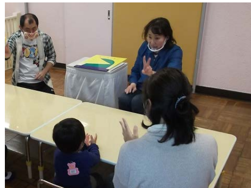
療育の様子（手遊び）