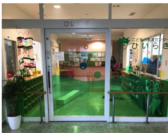
西東京市こどもの発達センターひいらぎ (児童発達支援センターへの移行予定施設)