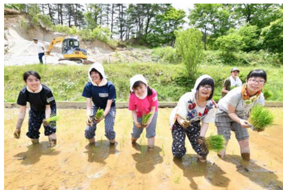
葛尾村の住民と若者が食卓を囲む風景 田植え体験を通じた都市の学生との交流