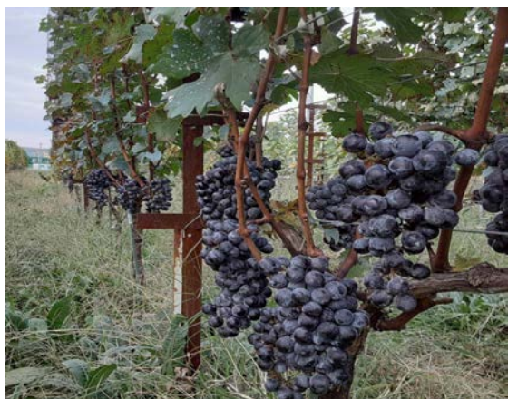
市内で栽培している収穫目前の カベルネ・ソーヴィニヨン