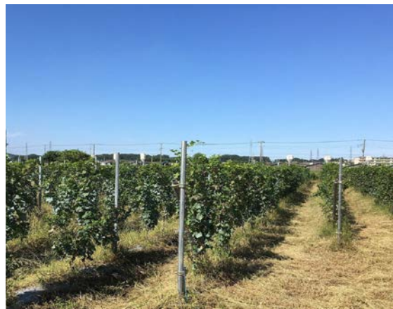
市内のカベルネ・ソーヴィニヨンと メルローの農園