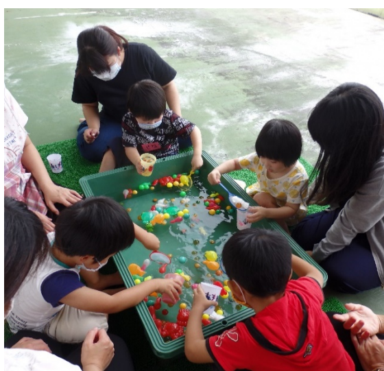
療育の様子（ボールすくい遊び）