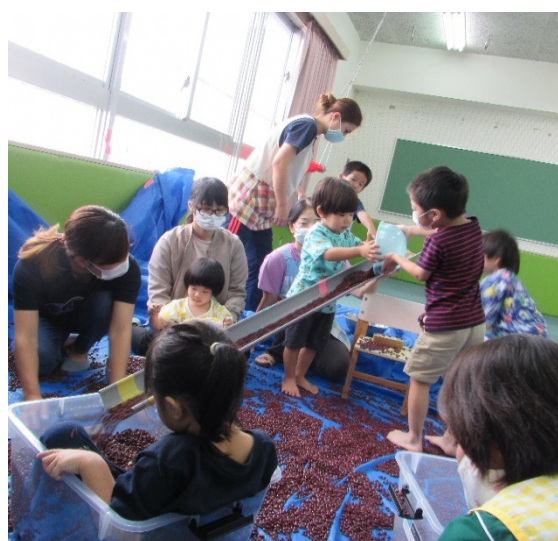
療育の様子（まめ遊び）