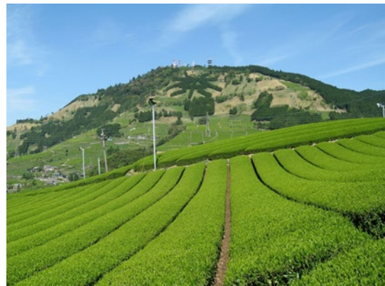
掛川市東山地区「栗ヶ岳」の茶文字 世界農業遺産「静岡の茶草場農法」実践地