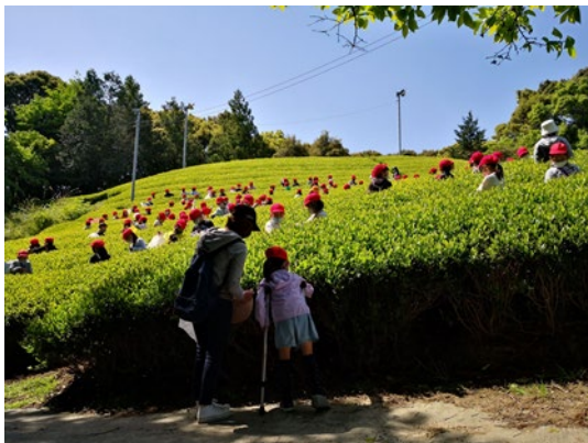
小学生による茶摘み体験の様子