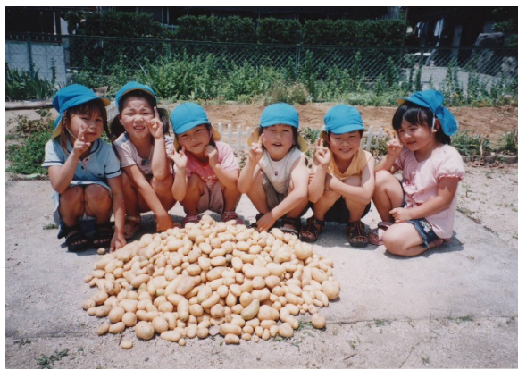
保育園のみんなと一緒に ジャガイモほりをした様子