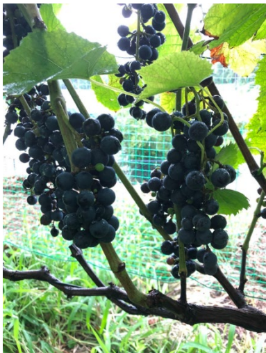
山ぶどう（ワイン用）