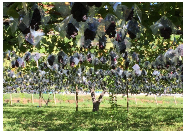
圃場（東阿知和地区）