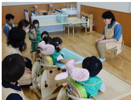
療育の様子（イメージ）