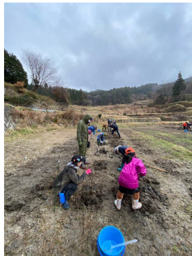
ぶどう苗木植体験イベント