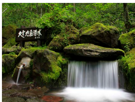
大雪旭岳源水の風景