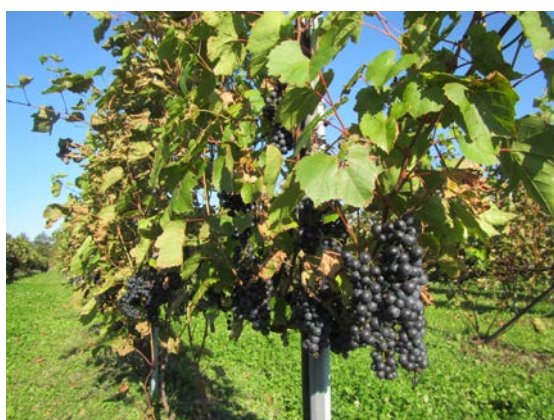
ワイン園場の様子