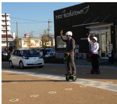
とよたエコフルタウンでの模擬走行