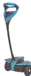
使用車両のトヨタ自動車 ウィングレット