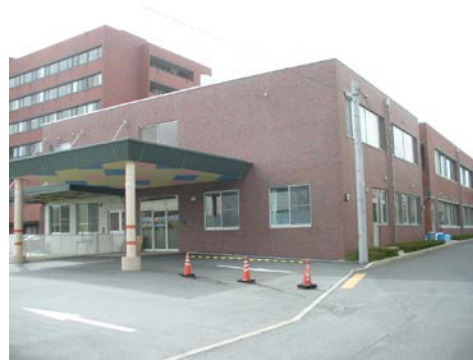
鳥取療育園外観写真