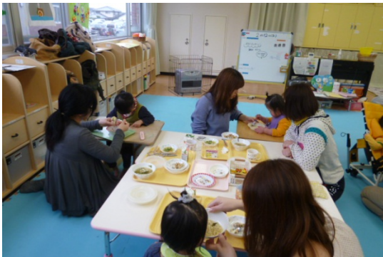
給食の提供を通じた子どもの健全育成 (食育)