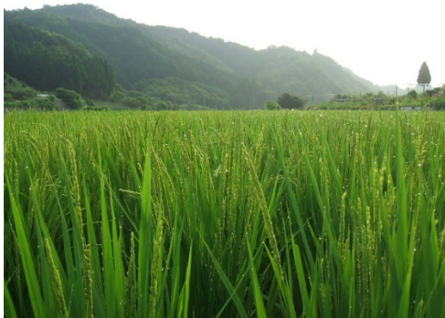
特別栽培米「きらり」