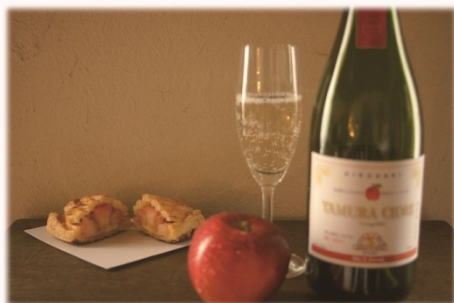
りんごとシードル 自家製アップルパイ