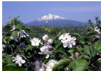
りんごの花と雪景色の岩木山