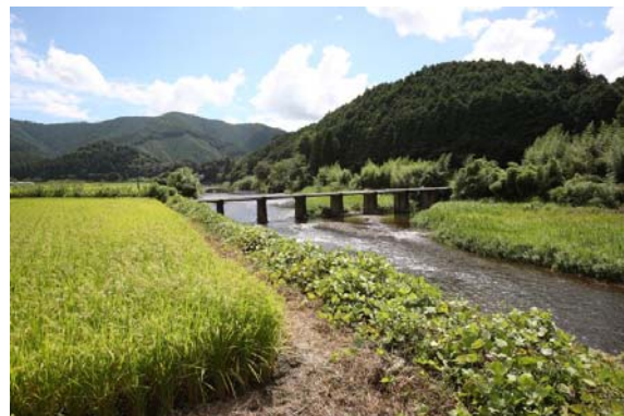
清流四万十川の恩恵を受け育つ稲