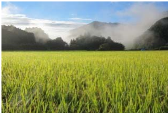
四万十の清粒「大野見米」