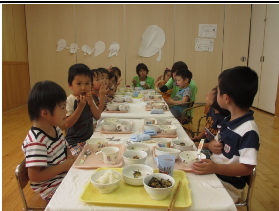
給食を、みんなで楽しく