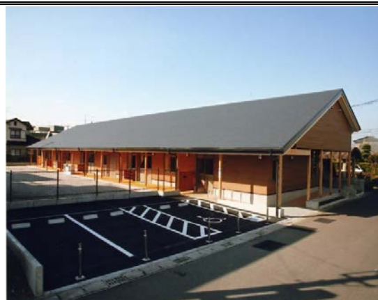
伊佐市子ども発達支援センター