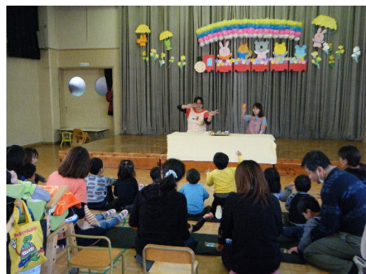
施設における食育の一場面 (カレー作り)