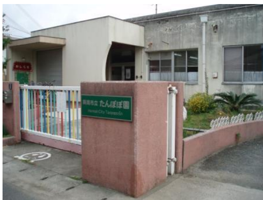
たんぽぽ園の外観