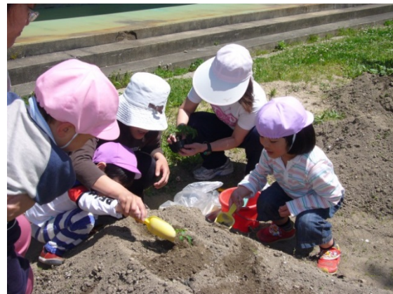
食育推進の一環でトマトの苗を 植えている風景