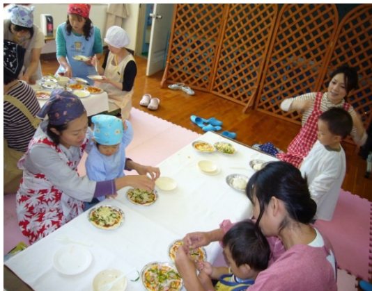
子育て支援拠点事業