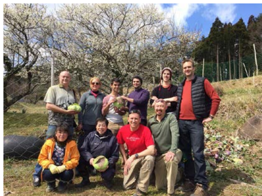
外国人旅行者による農業体験の様子