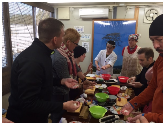
外国人向けの体験交流プログラムの様子