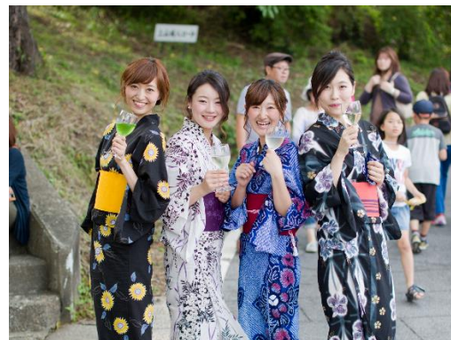
中心街でワインを楽しむイベント 「やまがたワインバル」