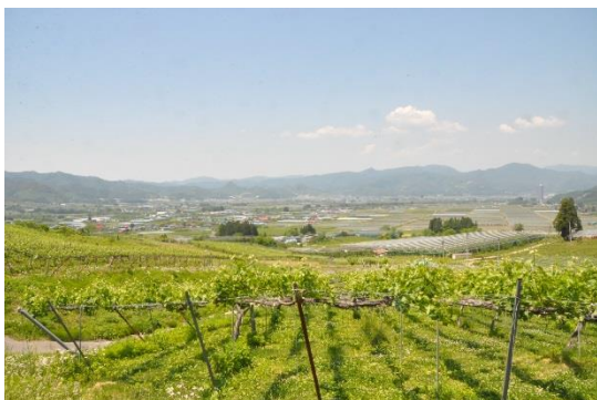
盆地を眺めるワインぶどう畑