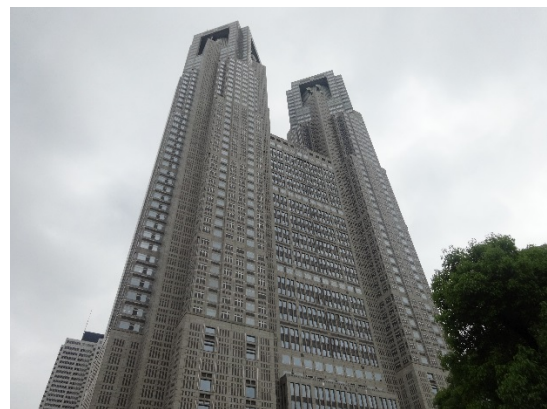
多くの外国人旅行者が訪れる東京都庁