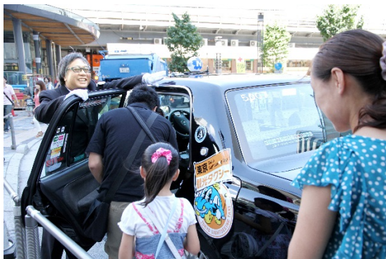
東京観光タクシー利用時の様子