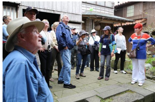
外国人観光客でにぎわう 小木地区宿根木集落