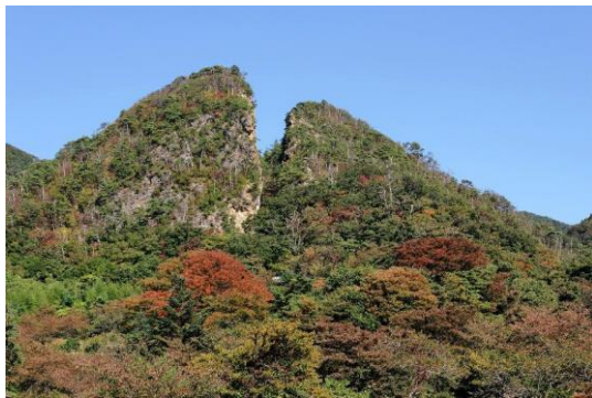
世界遺産登録を目指す、国史跡 「佐渡金銀山遺跡 道遊の割戸」