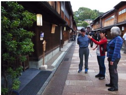
「ひがし茶屋街」でのガイド風景