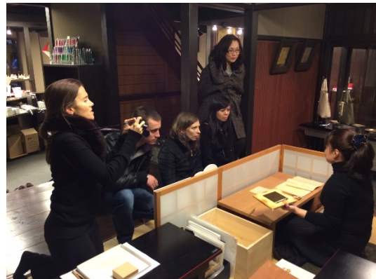
金箔移し実演見学