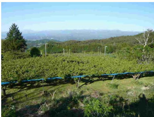
果樹生産に適した気候の下條村