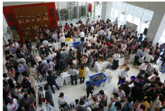
中心街で開催されている 「八戸ワインフェス」