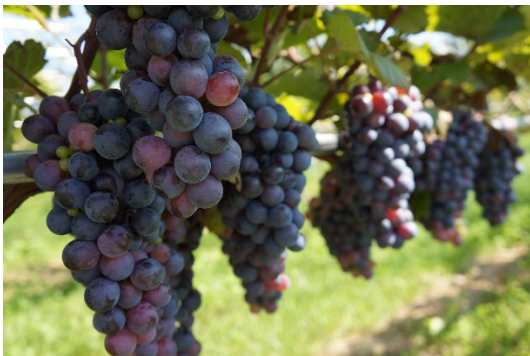
初めての収穫を迎える 「ワイン用ぶどう」