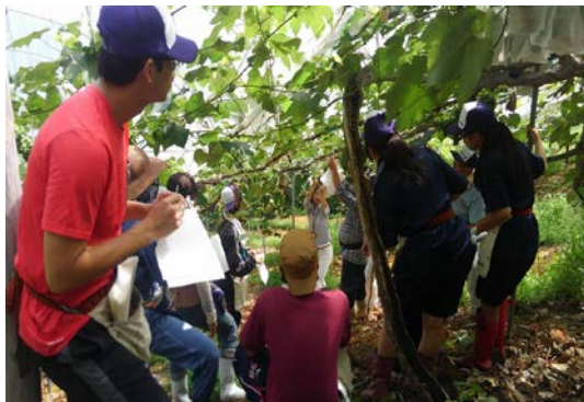
ぶどう栽培を手伝う 「ぶどうつくり隊」