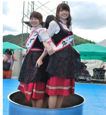
イベントでぶどう踏みをする ワイン娘