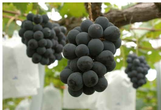
大粒・黒紫色が特徴のニューピオーネ