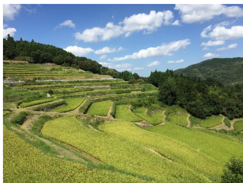
日本の棚田百選の小山地区棚田