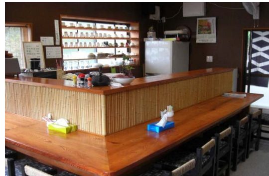
濁酒販売店舗の様子