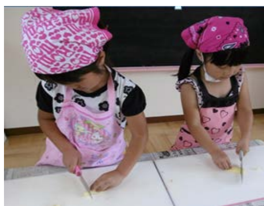
「クッキング保育」採れた野菜でカレー作り