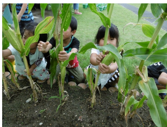
「食育」保育園で育てた野菜を収穫する園児