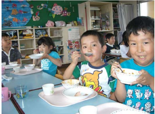
保育園で給食を食べる園児たち