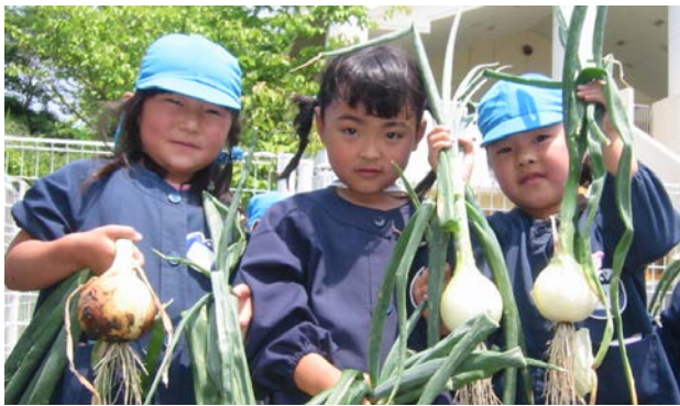
市内で収穫した農産物