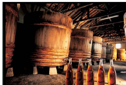
碧南発祥の白しょうゆの仕込み蔵