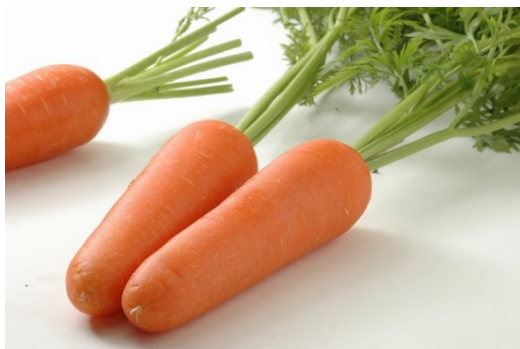
特産品の人参（へきなん美人）