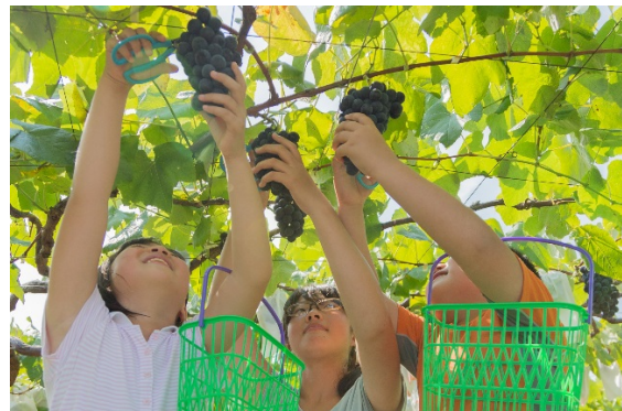
観光農園での果実狩り体験