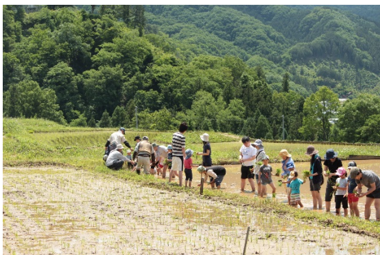
寺坂棚田での田植え体験