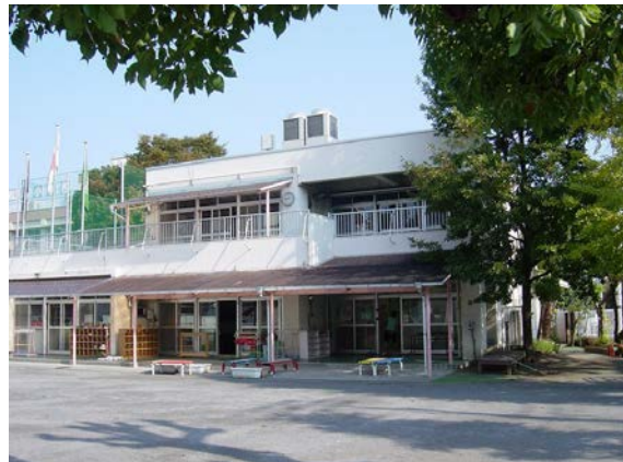
江戸川区発達相談・支援センター （整備予定施設）