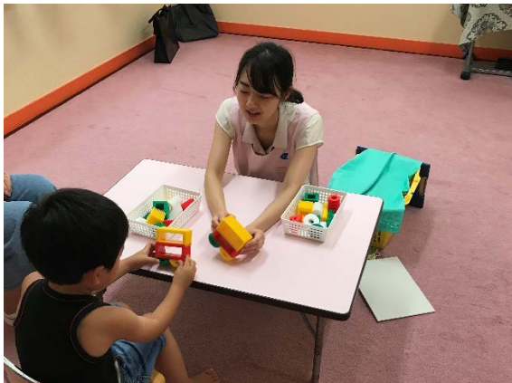
個別訓練の様子（机上課題）